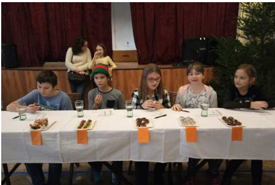
Zodpovědná dětská porota