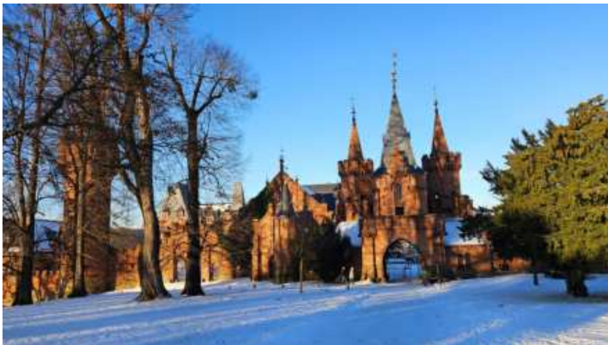
Hradec nad Moravicí