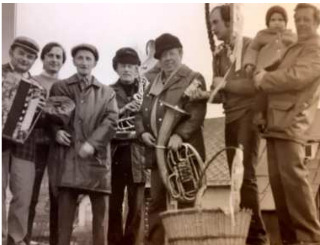
Kulatěnka, o které se blíže rozepíšeme v některém z dalších čísel Chucheláčku

Přejeme vám krásné léto, užijte si ho ve zdraví s rodinou i kamarády.