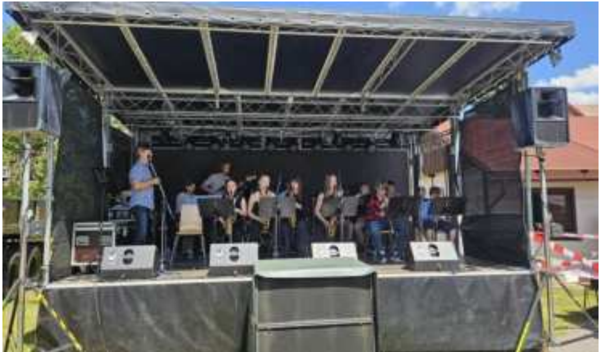
Miniband ZUŠ Semily