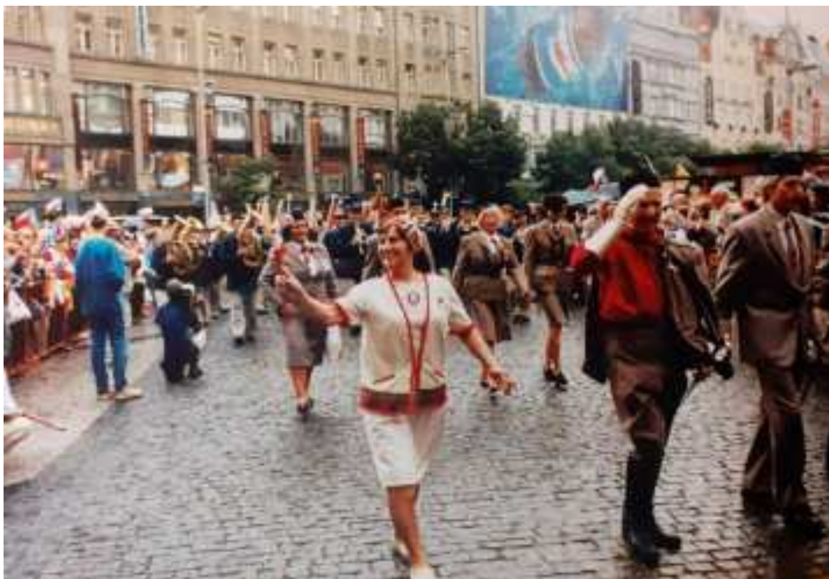
XIII. všesokolský slet v roce 2000.