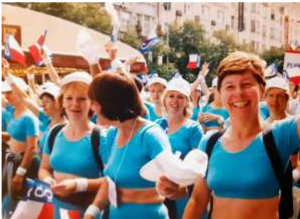
XII. všesokolský slet v roce 1994