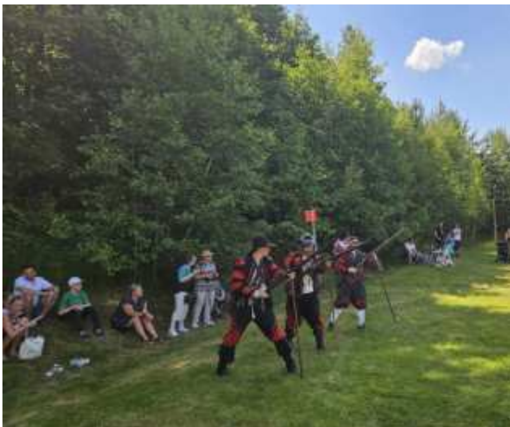
Šermířská skupina Schiavi z Liberce