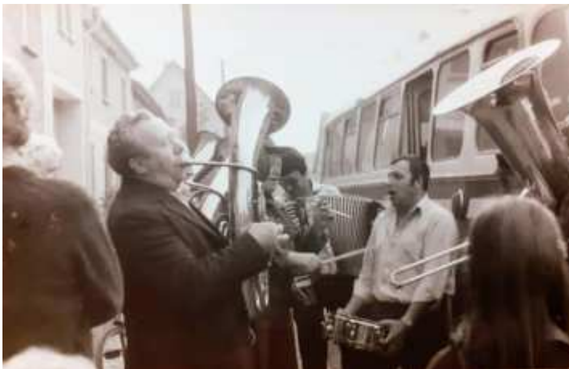
Kulatěnka na zájezdu